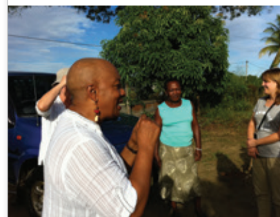
Te yu luku ini son, sabi tak yu ay o dungru. Als je in de zon kijkt, weet dan dat je ogen donker worden.