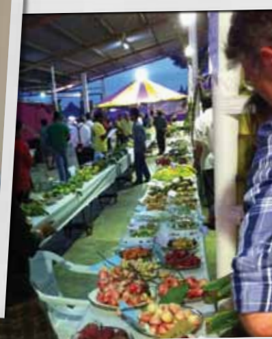
Een keur aan fruit en groenten op de Landbouwtentoonstelling

officiële ontvangsten van de districtscommissarissen praten we met veel mensen in dienst van de Surinaamse regering. Boeiende gesprekken, gedeelde belangen. Maar ook best een gek idee, met iemand spreken die ook maandelijks met president Bouterse aan tafel zit. Suriname en Nederland, zo veel geschiedenis. Die de ene keer bindt, en de andere keer dingen in de weg staat.