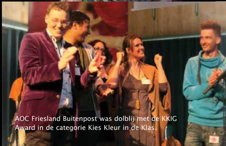
AOC Friesland Buitenpost was dolblij met de KKIG Award in de categorie Kies Kleur in de Klas.