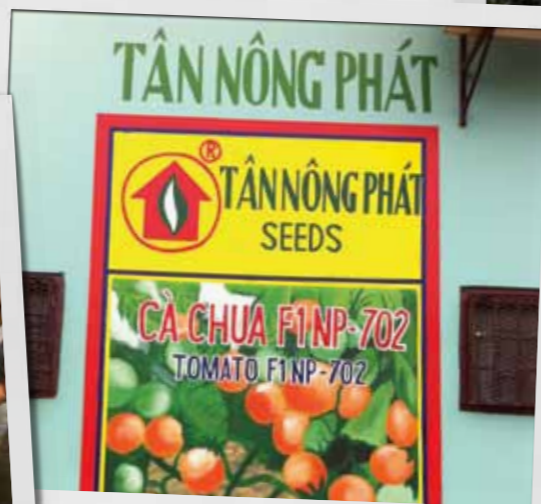
Typisch caribisch: muurschilderingen. Deze vond op de muur van de landbouwcoöperatie