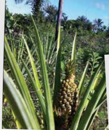
Fruit als onkruid langs de weg