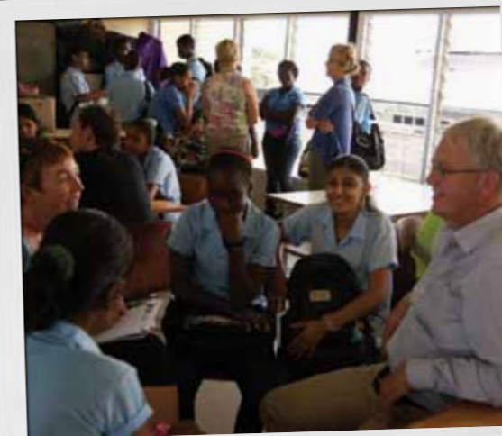
Ervaringen uitwisselen met leerlingen