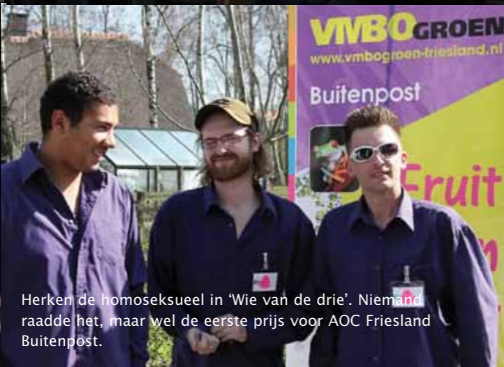
Herken de homoseksueel in 'Wie van de drie'. Niemand raadde het, maar wel de eerste prijs voor AOC Friesland Buitenpost.