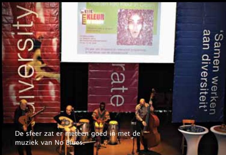
De sfeer zat er meteen goed in met de muziek van No Blues.