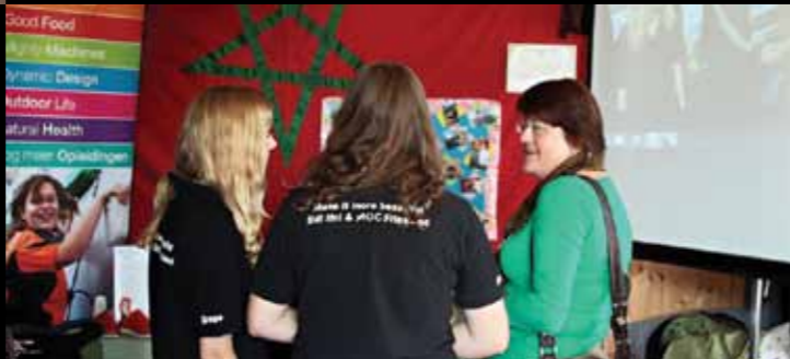
Prinsentuin Breda verhaalt over hun Marokkaars en alles wat dat in Nederland -op hun locatie- heeft veranderd. In stijl zullen we maar zeggen.