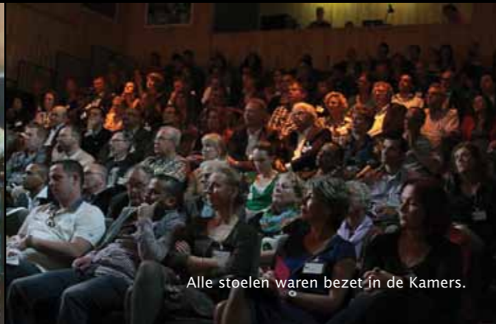
Alle stoelen waren bezet in de Kamers.