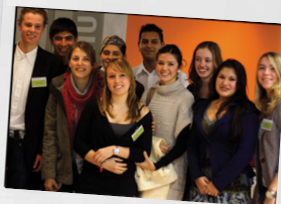
Met leerlingen van Lentiz Greenport

Een tweede winst zit volgens haar in de contacten met de Turks-Nederlandse gemeenschap in de regio's. Met politici, bedrijfsleven, ouders, ambtenaren. Die contacten waren volgens haar overigens niet altijd even