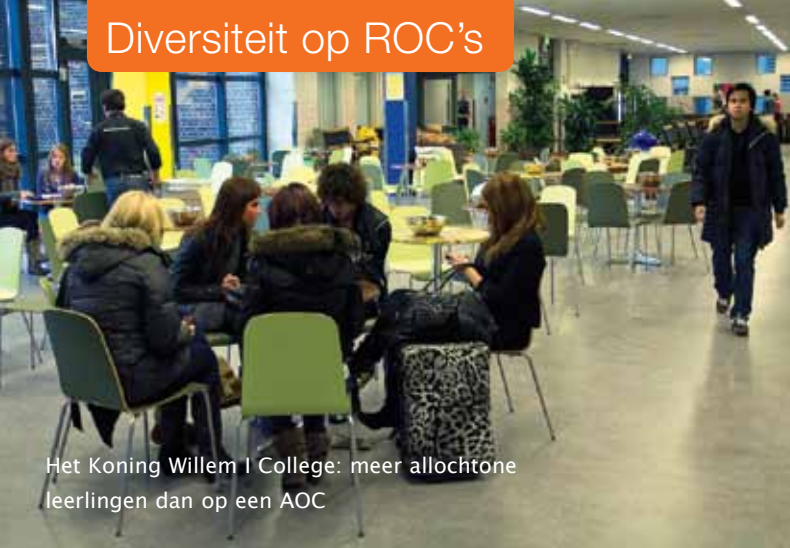
Het Koning Willem I College: meer allochtone leerlingen dan op een AOC