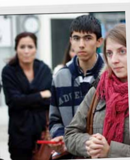
Bozdog, student Seluk Universiteit in tert naar uitleg over de demokwakerij

“Het perspectief? We zijn net begonnen. Allochtone kinderen gaan bijvoorbeeld nu niet naar een groenschool. Dat groenscholen zich zodanig profileren dat ze wel komen, is een hele opgave en een lange weg.”