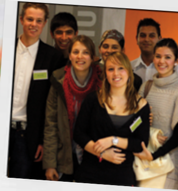
Met leerlingen van Lentiz 6

Een tweede winst zit volgens haar in de contacten met de Turks-Nederlandse gemeenschap in de regio's. Met politici, bedrijfsleven, ouders, ambtenaren. Die contacten waren volgens haar overigens niet altijd even