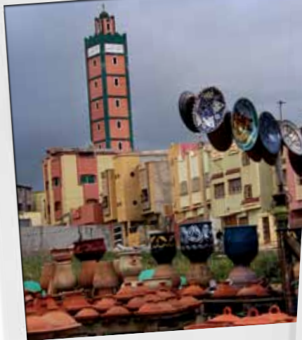
Aardewerk op de markt