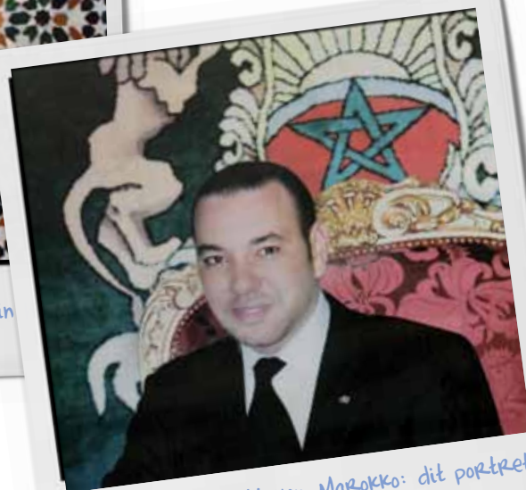
Koning Mohamed VI van Marokko: dit portret komen we bij al onze bezoeken weer tegen

in de bus. We hebben vertegenwoordiging van Helicon Opleidingen, Edudelta College, het Kies Kleur in Groen programmamanagement, Stoas Hogeschool en CPS. Bij elk ritje wisselen we in de bus van plaats, waardoor we ieder meer dan de gemiddelde wekelijkse vergadertijd intensief met elkaar praten. 'Wat doen jullie nu precies vanuit Kies Kleur in Groen landelijk?', is de meest gestelde vraag aan mij die week. Andersom heb ik als vraag, hoe het gaat op de vestigingen met Kies Kleur in Groen. Ik hoor enthousiaste verhalen over waar iedereen mee bezig is en merk, niet voor het eerst, dat allerlei informatie over het landelijke programma niet vanzelfsprekend bij docenten en teamleiders terechtkomt.