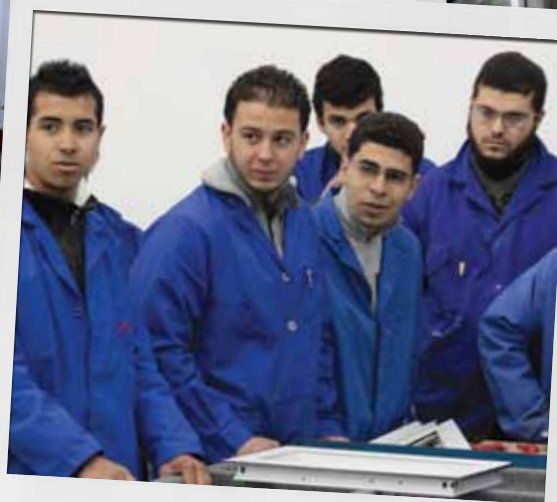
Les in groepen op een kleine plattelandsschool In Boukhrisse