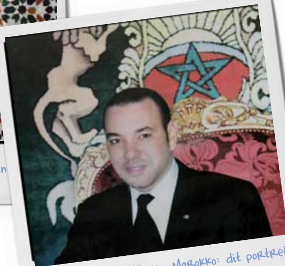
Koning Mohamed VI van Marokko: dit portret komen we bij al onze bezoeken weer tegen

in de bus. We hebben vertegenwoordiging van Helicon Opleidingen, Edudelta College, het Kies Kleur in Groen programmamanagement, Stoas Hogeschool en CPS. Bij elk ritje wisselen we in de bus van plaats, waardoor we ieder meer dan de gemiddelde wekelijkse vergadertijd intensief met elkaar praten. 'Wat doen jullie nu precies vanuit Kies Kleur in Groen landelijk?', is de meest gestelde vraag aan mij die week. Andersom heb ik als vraag, hoe het gaat op de vestigingen met Kies Kleur in Groen. Ik hoor enthousiaste verhalen over waar iedereen mee bezig is en merk, niet voor het eerst, dat allerlei informatie over het landelijke programma niet vanzelfsprekend bij docenten en teamleiders terechtkomt.