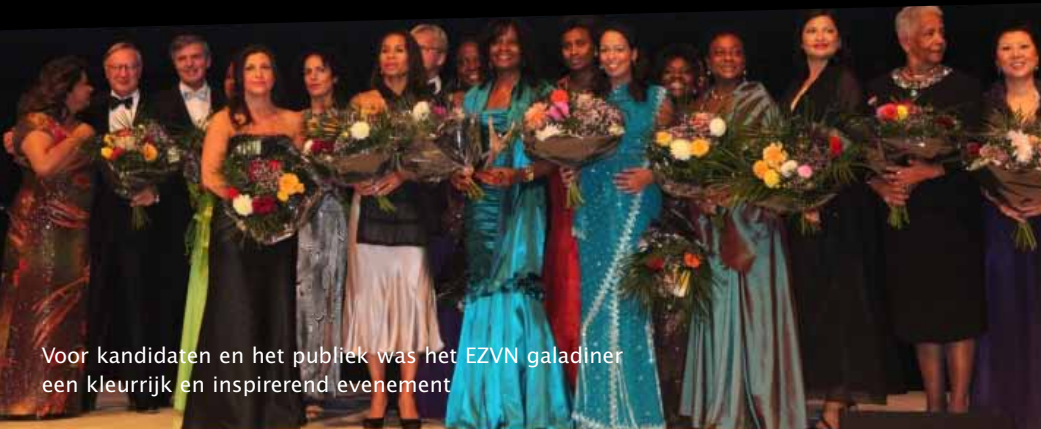
Voor kandidaten en het publiek was het EZVN galadiner een kleurrijk en inspirerend evenement