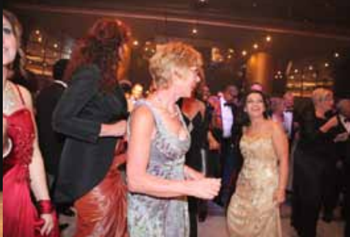
En er was ook nog gelegenheid om te dansen op de klanken van Trafassi "kleine wasjes, grote wasjes, doe ze in de - wasmachien".