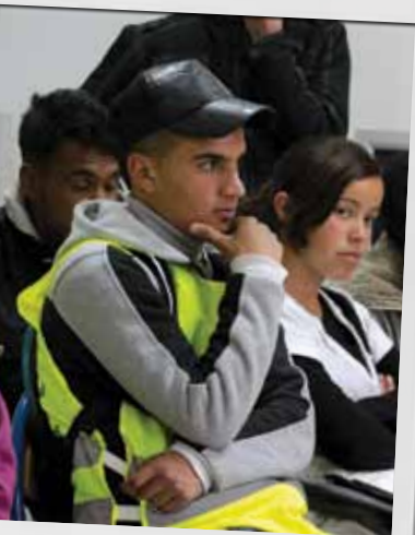
(VO-school) in Jerada. Alle stenen een olijfbom bij de school