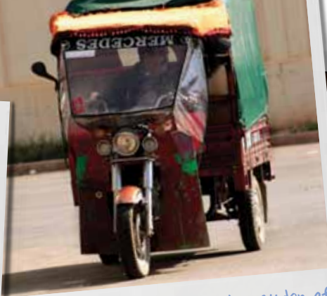
etje in vele formaten en soorten rijden af in bij de groente en fruitveiling in Oujda