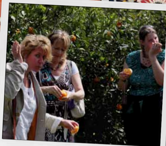
Sinaasappels vers van de boom. Lekker smullen op een sinaasappelplantage in Berkane