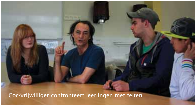
Coc-vrijwilliger confronteert leerlingen met feiten