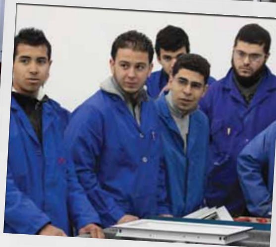
Les in groepen op een kleine plattelandsschool In Boukhrisse