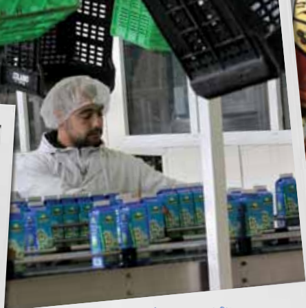
De inpakafdeling in een melkfabriek in Oujda