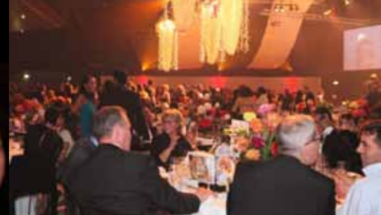
Tijdens het galadiner werd aan de door Aequor gesponsorde tafel geanimeerd gesproken over etnisch ondernemerschap en de meerwaarde voor de groene sectoren en onderwijs.