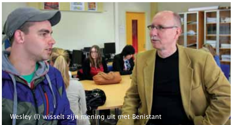
Wesley (l) wisselt zijn mening uit met Benistant