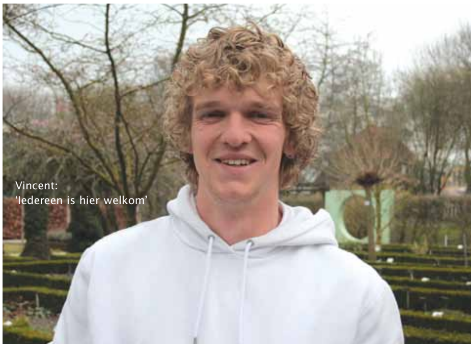
Vincent: 'Iedereen is hier welkom'